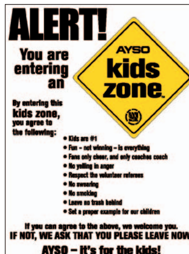
「注意！あなたはキッズゾーンに入ろうとしています」アメリカ